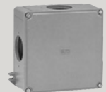
Cajas estancas, derivación y accesorios