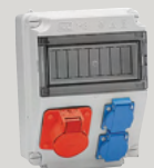
Cajas montadas y conexionadas